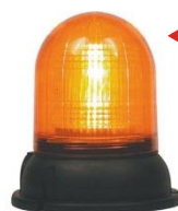
Senyal lluminós V-2