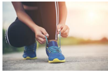
BENEFICIOS DEL DEPORTE