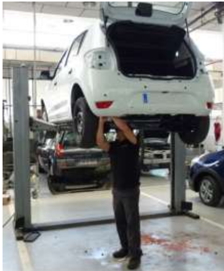
Postura forzada de brazos