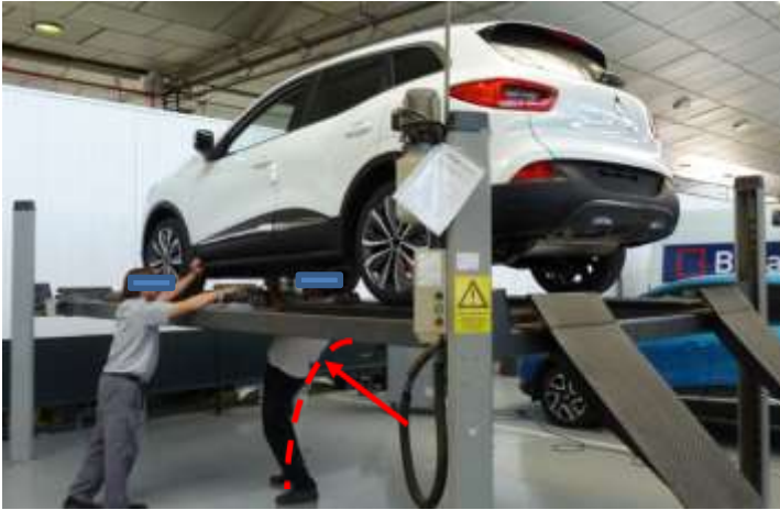
Postura forzada de espalda y cuello