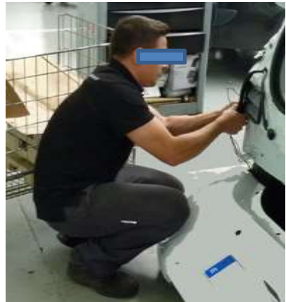
Trabajando en cucullas